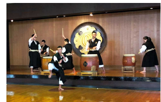
▲多度津京極少林寺拳法太鼓