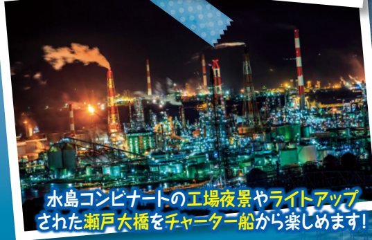
水島コンビナートの工場夜景やライトアップされた瀬戸大橋をチャーター船から楽しめます!