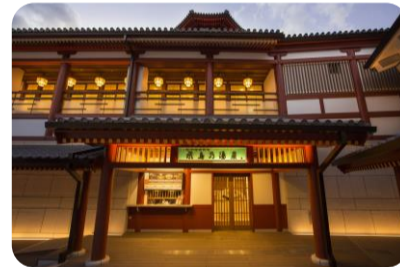
道後温泉別館 飛鳥乃湯泉