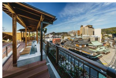
道後温泉 空の散歩道

※当日の天候や列車の運行状況等により、運休または運行ダイヤ及びのりばが変更となる場合がございます ※サイクルトレインしまなみ号は、普通車両と併結して運行し、松山方1両を専用車両とします。普通車両には自転車の持ち込み及びご乗車はできません。 ※波止浜駅-今治駅間のみの乗車はできません。