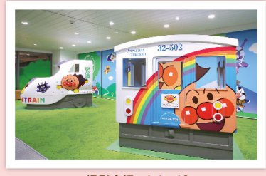
撮影会場 イメージ