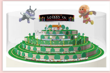
【バースデータイム】イメージ

約6分間、お名前とお誕生日がLEDに表示され、アンパンマンやばいきんまんからのお祝いといっしょに記念撮影が楽しめるよ！ ★お名前・お誕生日はご指定いただけます。※通常は対象旅行商品を購入した方だけの特典です。