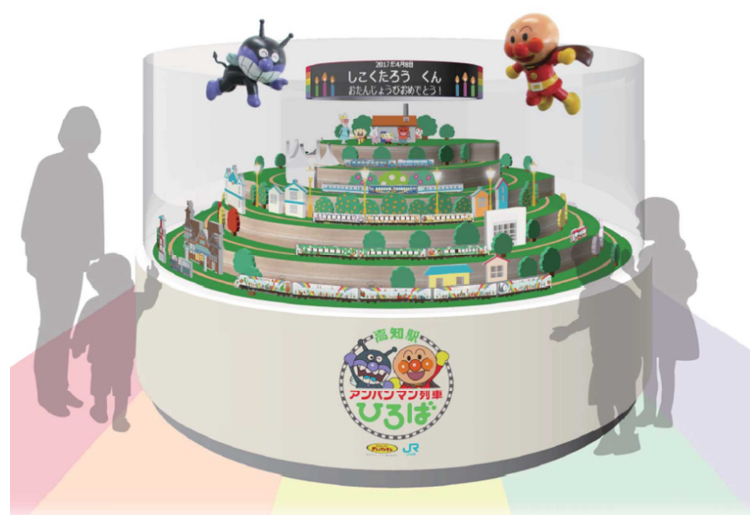
(メインオブジェでの「バースデータイム」イメージ)