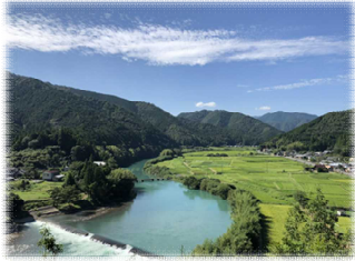
高南台地の広がり