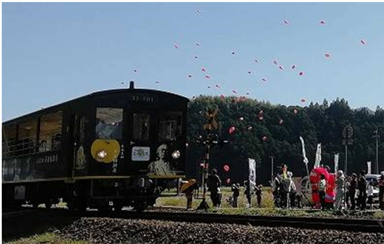
別紙3 日高村コスモスまつり昨年度の様子