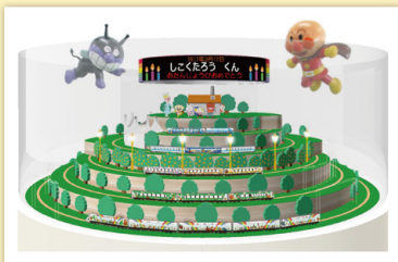
【バースデータイム】イメージ

約6分間、お名前とお誕生日がLEDに表示され、アンパンマンやばいきんまんからのお祝いといっしょに記念撮影が楽しめるよ！