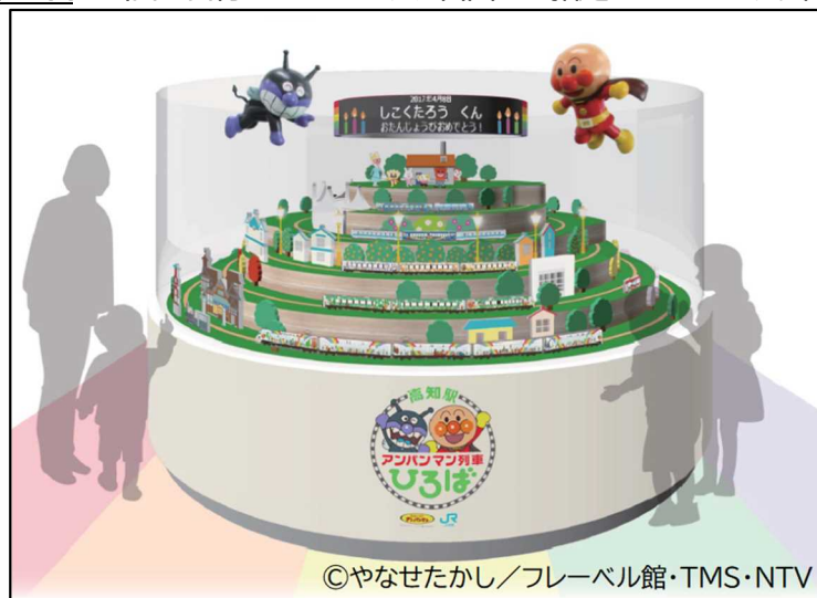
(メインオブジェでの「バースデータイム」イメージ)

音楽に合わせて5つのアンパンマン列車がメインオブジェの中を走り、アンパンマンとばいきんまんがお祝いしてくれます。オブジェ上部のLEDに お名前とお誕生日 が表示され、約6分間記念撮影が楽しめます。通常は特定の旅行商品購入者だけの限定特典です。 (※ お名前とお誕生日 は当日の日付にかかわらず、自由にご指定いただけます。)