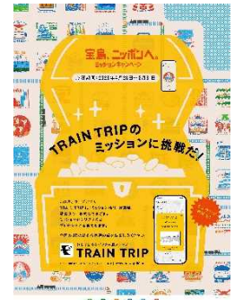
(ミッション告知のポスター)