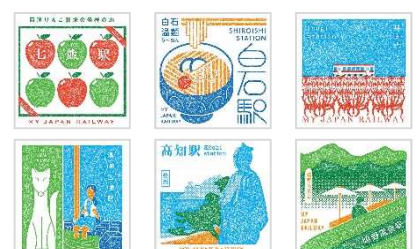
（追加するスタンプの一例）

4月28日（金）に、120個の新スタンプを追加します。新スタンプの対象駅は、これまでスタンプが無かった駅も、既にスタンプがある駅でデザインをリニューアルする駅もございます。新スタンプの対象駅はWEBアプリ内でご確認ください。