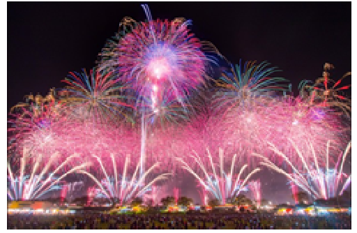
音楽と花火の奇跡の共演・花火競技大会イメージ

出発日：2019年10月5日(土) TW:TAIGBW004A 旅行代金(大人・子供同額)：9,800円