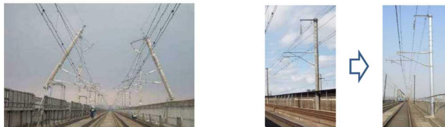
左：地震による電柱損傷例 右：電柱の耐震化事例 ・電気設備に係る耐震補強の事例（※R4.5.31 国交省・新幹線の地震対策検証委員会資料より）