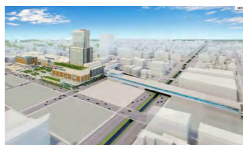
新幹線札幌駅(イメージ)