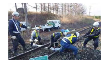
鉄道施設の設備投資や修繕