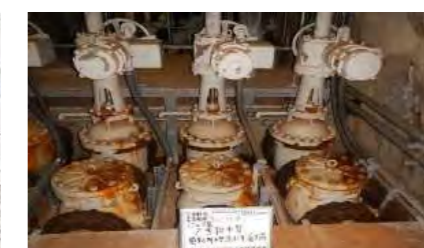
青函トンネル排水設備