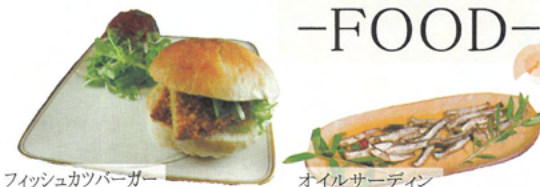
フィッシュカツバーガー