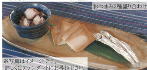
※写真はイメージです。詳しくはアテンダントにお尋ね下さい。