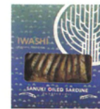
オイルサーディン