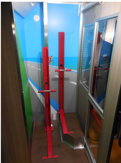
サイクルルームのイメージ