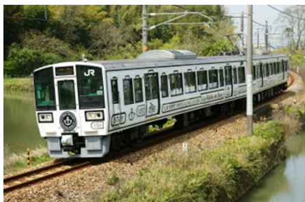
La Malle de Bois 外観

旅支度をする特別な時間を楽しむ「旅の道具箱」をコンセプトに、せとうちエリアの広域周遊観光を楽しむ観光列車として、今春より運転を開始した「La Malle de Bois(ラ・マル・ド・ボア)」を冬期間も運転します。