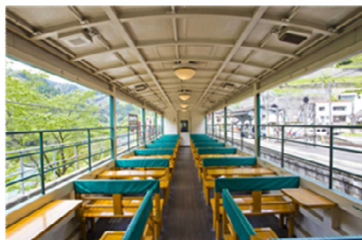
トロッコ列車車内