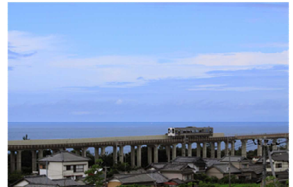
ごめん・なはり線運転区間（イメージ）