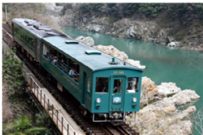
トロッコ列車外観