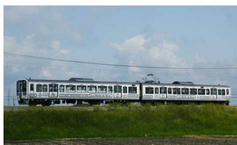
La Malle de Bois 外観