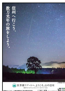
木曾開田高原の星空

信州キャンペーン実行委員会が制作した5連貼りポスターを全国の主な駅に掲出します。