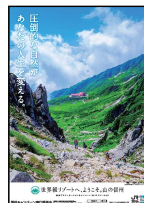
千畳敷カール乗越浄土 ※画像は全てイメージです。