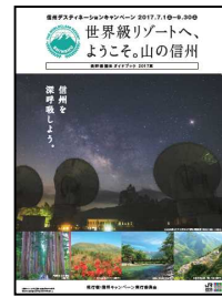
【キャンペーンガイドブック】

各エリアの観光情報やキャンペーン期間中に開催されるイベント情報などを掲載したキャンペーンガイドブックを全国のJRの主要駅や旅行会社窓口等で配布します。