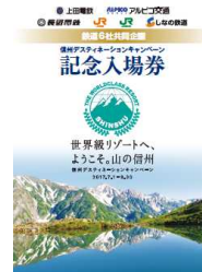
【信州DC記念入場券台紙イメージ】