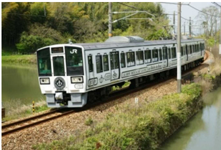
La Malle de Bois 外観