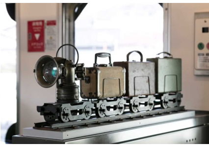
アート作品「旅の道具の旅」