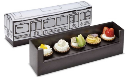
La Malle de Bois 車内限定スイーツBOX 「旅するせとうちスイーツBOX」