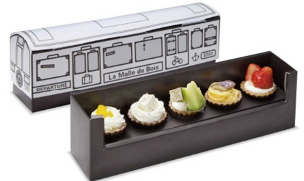
La Malle de Bois 車内限定スイーツBOX 「旅するせとうちスイーツBOX」