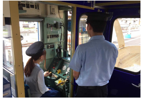
▲運転体験実施イメージ