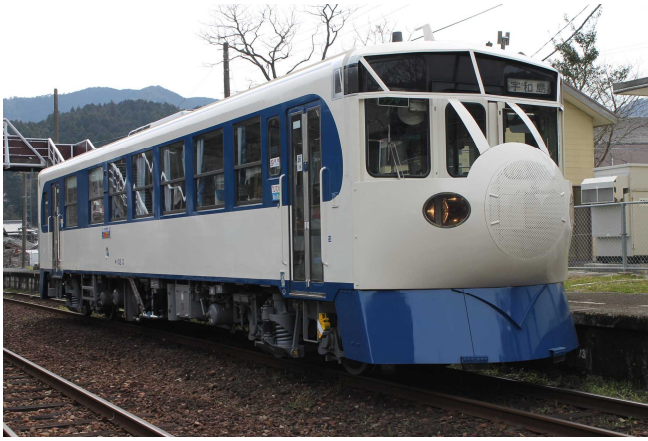
▲「鉄道ホビートレイン（ブラレール号）」