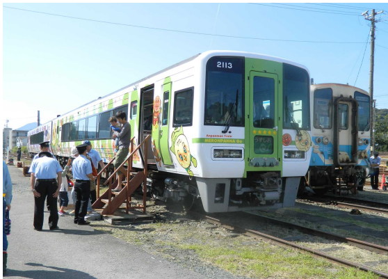
▲2000系特急気動車（振子体験）実施イメージ