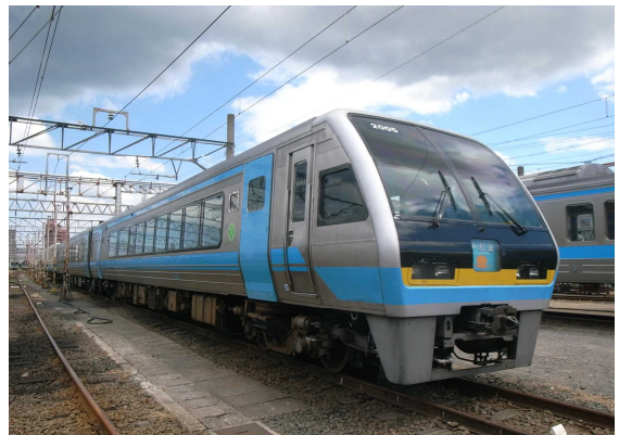
▲JR四国 2000系特急気動車 （制御式自然振子車両）