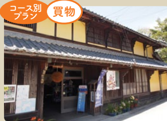
100年以上の歴史を受け継ぐ老舗「正木酒造」。