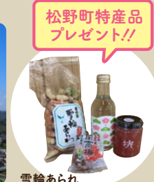
松野町特産品プレゼント!! 雪輪あられ、梅サイダー、桃ジャム、梅干しピロー。