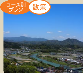
眺望が美しい「河後森城跡」。