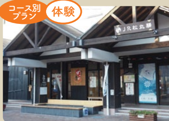
駅前の足湯スペースでほっとひとやすみ。