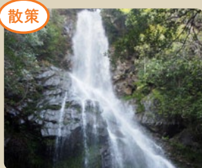
落差約30m、迫力満点の「天ヶ滝」。

ツアーでは、棚田で収穫された新米を使ったオリジナル「お結び」作り体験や、郷土料理を堪能していただきます。また、地元住民との交流も深めつつ、美味しいお米の炊き方や郷土料理について知識を深めます。秋にふさわしい美味と教養の旅をお楽しみください。