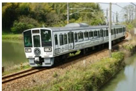
La Malle de Bois 外観