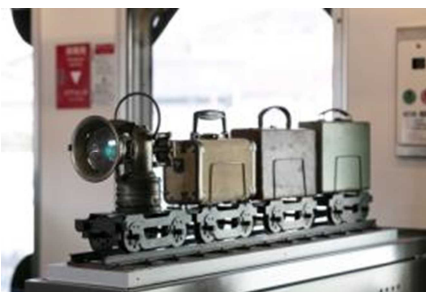
アート作品「旅の道具の旅」