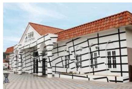
宇野駅の駅アート