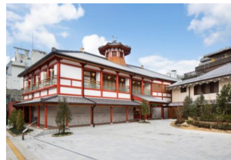
道後温泉別館 飛鳥乃湯泉