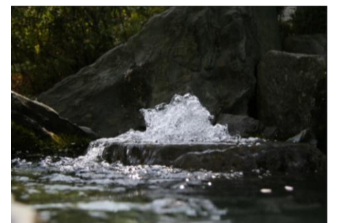
西条の名水「うちぬき」