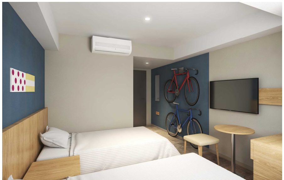
【サイクルルームイメージ】