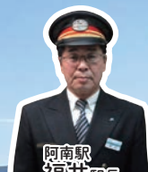
阿南駅 福井 駅長