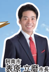
阿南市 表原 立磨 市長

四国最東端に位置する阿南市は、海・山・川の自然に恵まれ、若杉山遺跡や阿波水軍などの由緒ある史跡と四国遍路のお接待文化が息づく一方で、LEDの世界的シェアを誇る地場企業があるなど、豊かな自然と文化、産業が鮮やかに調和したまちです。