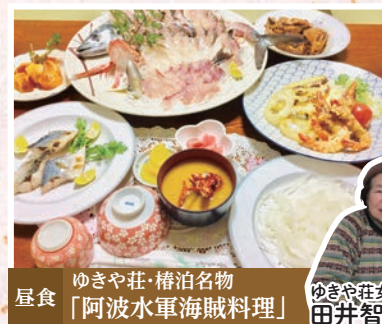
ゆきや荘・椿泊名物 「阿波水軍海賊料理」 屋食