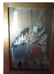
椿泊 佐田神社の絵馬

四国内各地から阿南駅までのJR往復＋昼食及び各種観光ガイドの案内がセットになった募集型企画旅行として募集します。