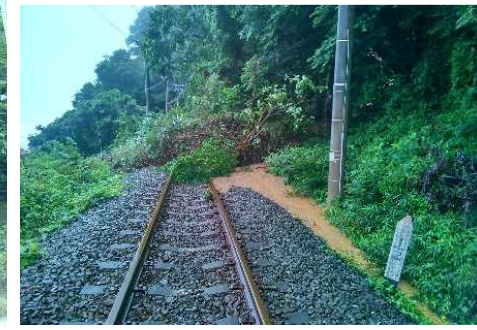
①予讃線 本山・観音寺