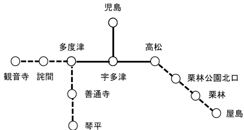
別表 1 (第7条第1項) 利用エリア