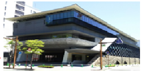
高知県立高知城歴史博物館