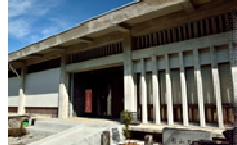
佐川町立青山文庫