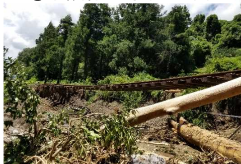
⑩予讃線 下宇和・立間