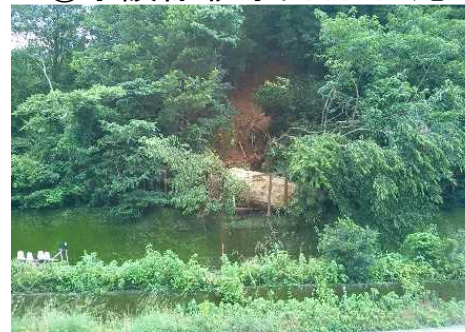
⑥予讃線 伊予出石・白滝