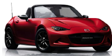
イメージ ©マツダ株式会社