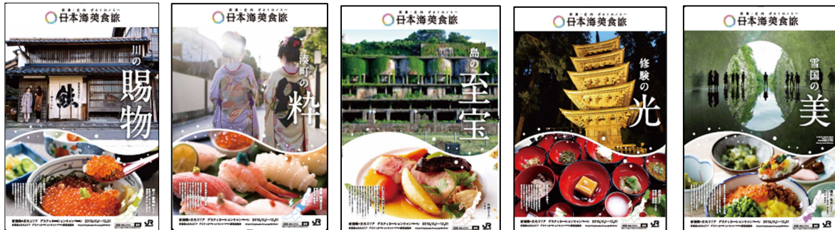
【村上・新発田エリア】 村上・町屋とはらこ丼

DC推進協議会制作のポスターを9月1日(日)～9月30日(月)の間、全国の主な駅に掲出します。