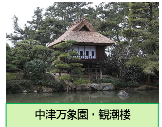
中津万象園・観潮楼

四国に眠る地域資源・文化資源を掘り起こし、地域と協働した魅力的な観光素材・付加価値の高い文化素材に磨き上げ「四国家のお宝」としてプロモーションする取組みです。