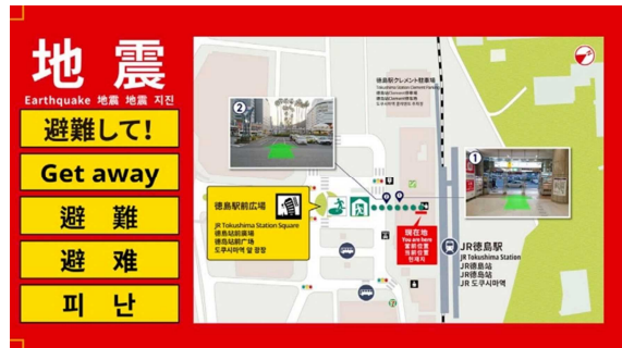
【地震時の避難誘導表示】