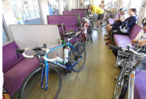
電車の旅を楽しみます♪