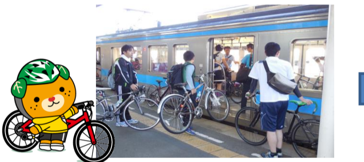
自転車をそのまま電車に持ち込みます