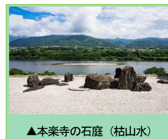
▲本楽寺の石庭(枯山水)