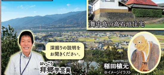
舞中島の高石垣住宅