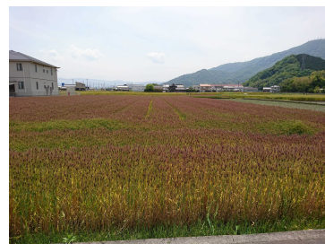
▲ラベンダーカラーに色づく麦畑

https://www.jr-eki.com/tour/course/HSMGAH060D