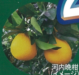
河内晩柑 (イメージ)

飲み放題メニュー キリン一番搾り・ハイボール・レモンチューハイ オレンジジュース・烏龍茶