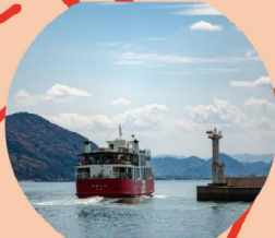
瀬戸内国際芸術祭 2025 秋会期 開催中!