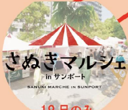
19日のみ さぬきマルシェも 同時開催予定!