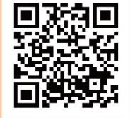
《インフォメーション》