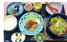
【やなせ定食】(南国市)