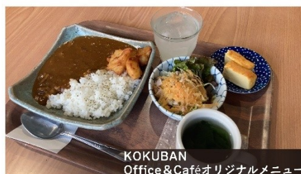
KOKUBAN Office & Cafe オリジナルメニュー