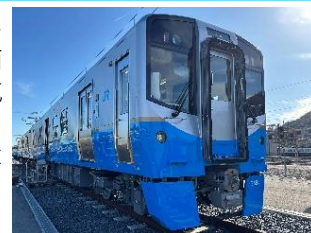
3600系ハイブリッド式ローカル車両

当社では、2050年カーボンニュートラルを目指し、省エネルギー化やCO2排出量削減の観点から、従来より軽量化されたステンレス製車体やVVVFインバータ制御システムを搭載した電車車両の導入、機関出力を上昇しつつ、燃焼効率の改善により有害成分を有したガス排出を大幅に削減した特急気動車の導入に努めてきた結果、省エネ車両導入率は90.1%(2024年度実績)を達成しています。また、2025年12月に国鉄時代の老朽気動車の置換となるハイブリッド式ローカル車両の量産先行車4両(2編成)が完成し、性能確認試験を実施したのち、営業運転を開始します。なお、量産車は2027年度から順次導入を予定しており、CO2排出量の更なる削減を進めていきます。