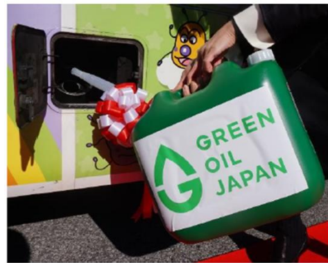
「ユーグレナバイオディーゼル燃料」給油の様子