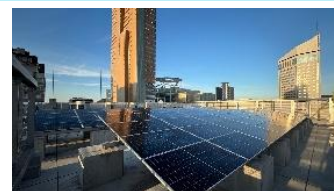
太陽光発電 (TAKAMATSU ORNE)

現在では、宇多津駅構内(太陽光発電パネル1,176枚、最大出力294kW)や2024年3月に開業した「TAKAMATSU ORNE」等四国内4ヶ所に最大出力600kWの太陽光発電設備を保有しています。