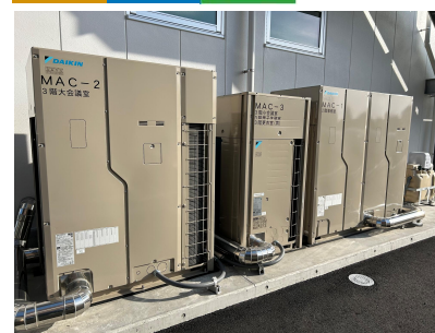
高効率空調(四国電設工業(株)松山営業所)