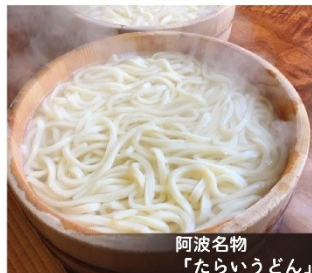
阿波名物 「たらいうどん」