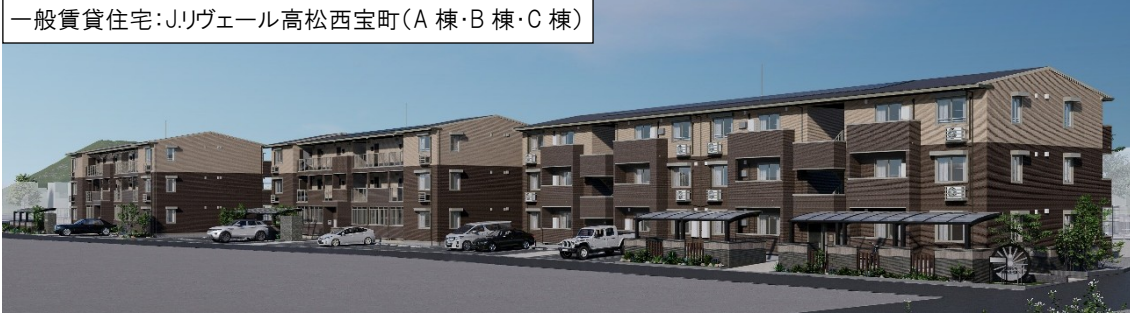
一般賃貸住宅:Jリヴェール高松西宝町(A棟・B棟・C棟)