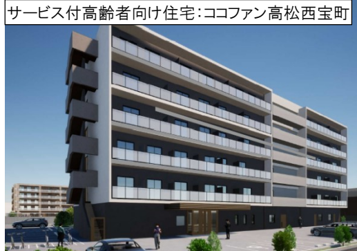
サービス付高齢者向け住宅:ココファン高松西宝町