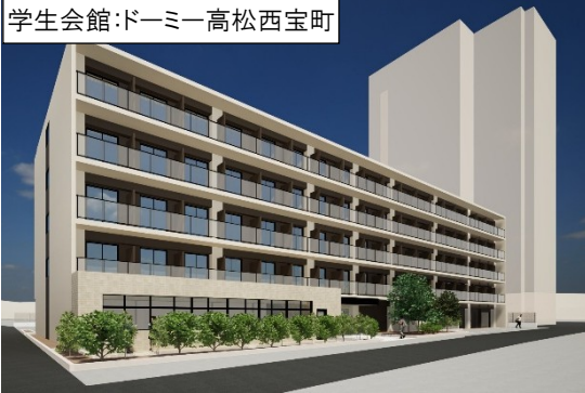
学生会館:ドーマー高松西宝町