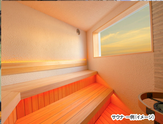
サウナ一例 (イメージ)

※写真は5月提供メニュー (イメージ) です! 毎月に変更がございます。 ※季節により内容・器が変更になる場合があります。