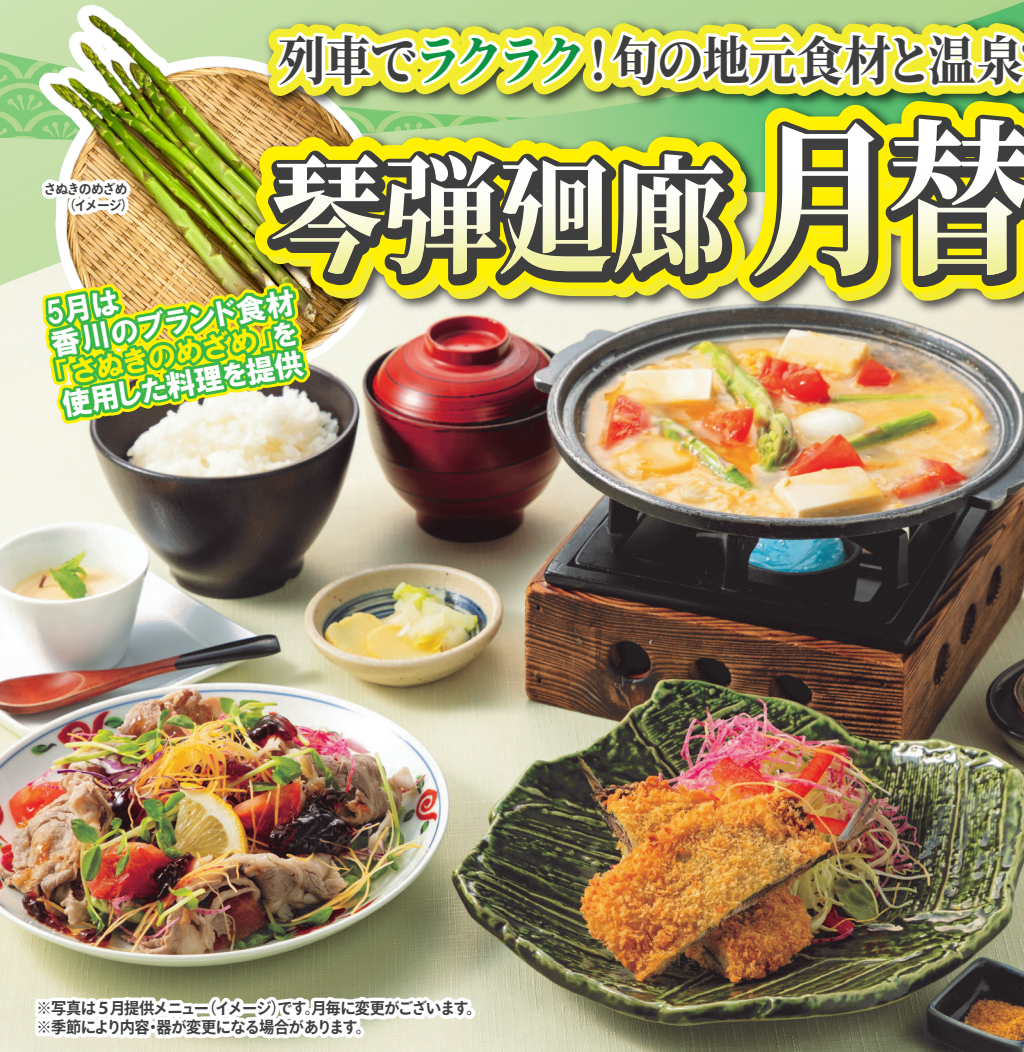
さぬきのめざめ (イメージ)