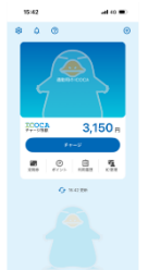
モバイルICOCAの画面イメージ