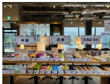
ずらりと並ぶ全国の「おやつ」