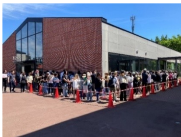
江別 蔦屋書店の様子