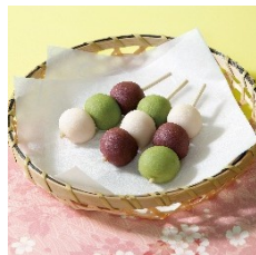
写真は全てイメージです。