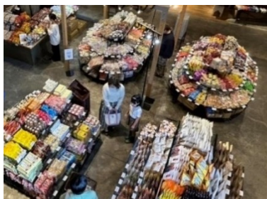
高知 蔦屋書店の様子