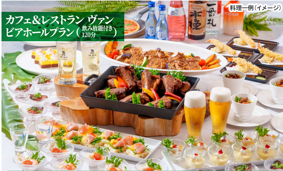
料理一例(イメージ)

飲み放題メニュー 生ビール・ワイン(赤・白)・焼酎(麦・芋)・梅酒・カクテル各種