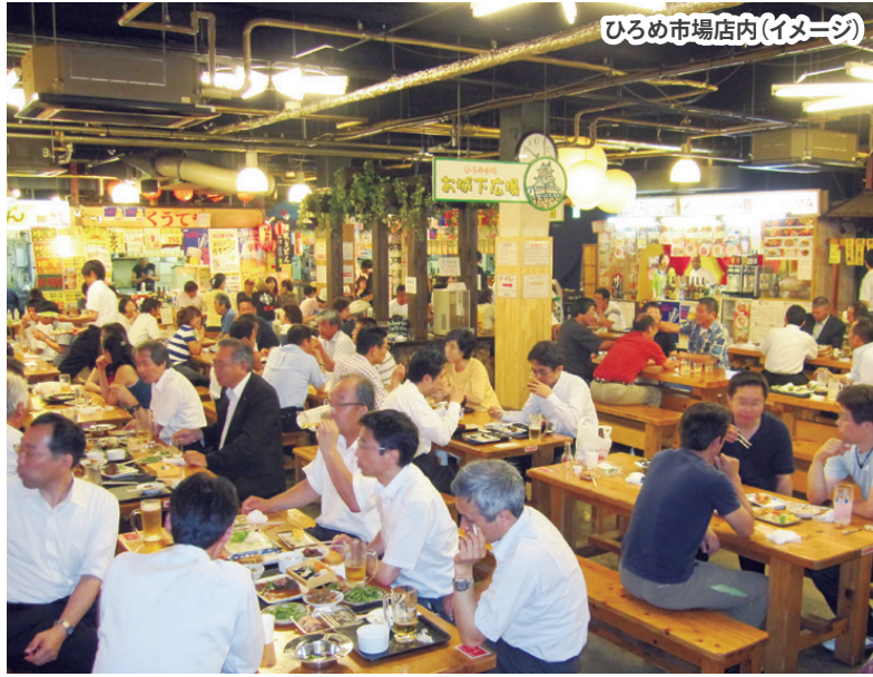
ひろめ市場店内(イメージ)

毎日が日曜日。 土佐を味わう飲食店、生きのいい 鮮魚店、ユニークな雑貨店など様々 な個性・特徴を持つお店が集まった 屋台村。市場内の飲食店で購入した お料理を自由席にてお召し上がりくだ さい。