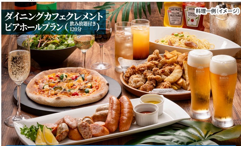
料理一例(イメージ)