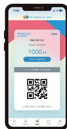
アプリ画面（イメージ）

お買い物やご飲食いただいた際にアプリ上の会員証画面をご提示いただくと、ポイントの付与、利用が可能になります。