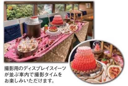
撮影用のディスプレイスイーツが並ぶ車内で撮影タイムをお楽しみいただけます。