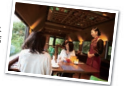
和軽食とスイーツはアテンダントがお席までお持ちします。